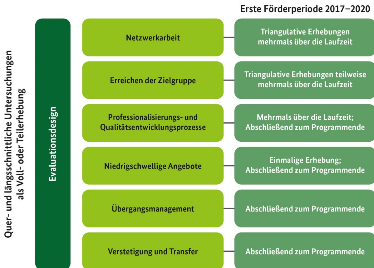
Abbildung 2: Evaluationsdesign zur Evaluation des Bundesprogramms „Kita-Einstieg: Brücken bauen in frühe Bildung“

Ziel der Evaluation ist es, die im Bundesprogramm „Kita-Einstieg: Brücken bauen in frühe Bildung“ geschaffenen Bildungsangebote und -strukturen in den Blick zu nehmen, um herauszufinden, inwieweit Entwicklungsprozesse in der inklusiven Frühpädagogik angestoßen, Professionalisierungsansätze für Fachkräfte erweitert sowie ein Übergangsmanagement in der frühkindlichen Bildungslandschaft gestaltet werden sollten. Dazu wurden verschiedene übergreifende und themenspezifische Forschungsfragen formuliert, um die Umsetzung des Programms „Kita-Einstieg“ zu skizzieren und zu evaluieren. Zur Beantwortung der Forschungsfragen wurde ein mehrdimensionales formatives und summatives Evaluationsdesign gewählt.